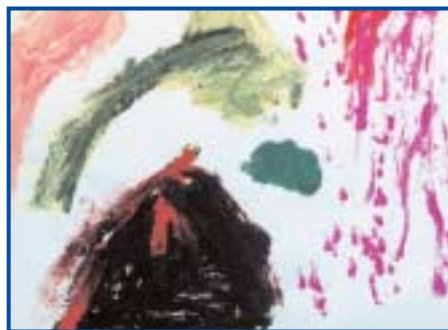
"ausbrechender Vulkan unter Feuerregen"

Die Bilder veranschaulichten deutlich die destruktiven innerpsychischen Gefühlszustände des Jungen und die in bedrohlich wirkenden, dunklen Farben dargestellten Szenarien zeigten eindrucksvoll das Ausmaß von Zerstörung: