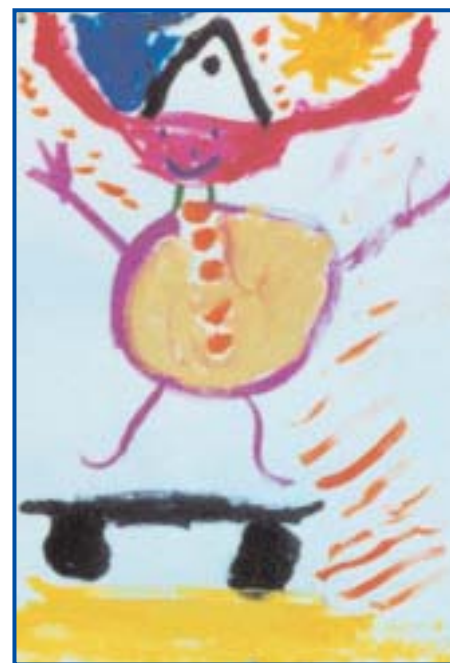
"Kuscheltier auf einem Skateboard"

Bildaufbau und Erzählstruktur entsprachen seinem Alter. Er malte sein Kuscheltier auf einem Skateboard, das im Fahrtwind unter Sonnenschein durch das Bild "brettert."