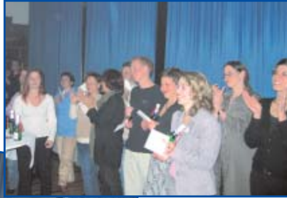
Ein Ausschnitt beider Teams