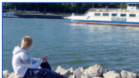
Besuch am Drachenfels.

Nach dem Frühstück konnte es dann endlich losgehen! Taschen ins Auto, Verpflegung eingeladen, Hexe Lilli in den CD-Player und so ging die Fahrt dann auch schnell vorbei.